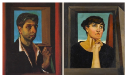
La storia di Alceste sbarca a Firenze