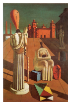
Doppio appuntamento per il libro "Alceste"