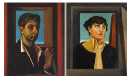
Cambio di programma per "Alceste"