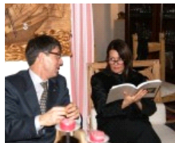
L'amore di De Chirico per Antonia spiegato dall'autore di "Alceste"